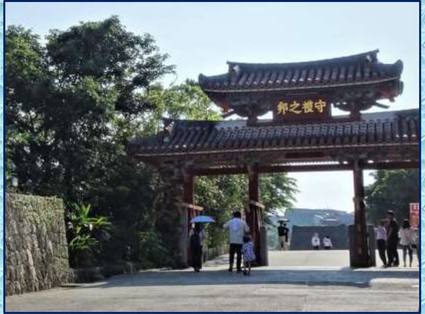
守礼の門