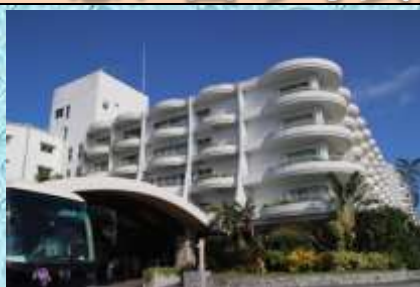
2日目宿泊…オーシャンスパ