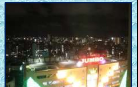
ホテルから見た那覇市内の夜景