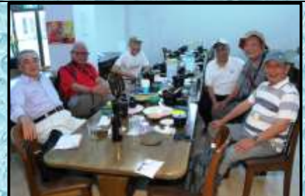
最後の昼食…