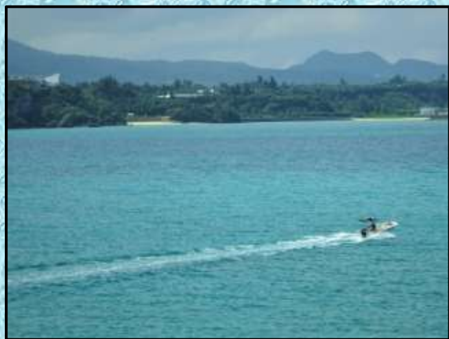
エメラルドが眩しい沖縄の海…