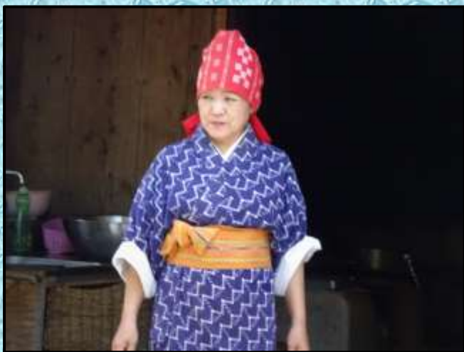
沖縄の女性…