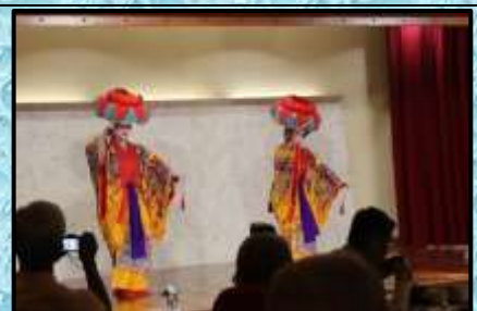
うらしま…琉球踊りの観劇