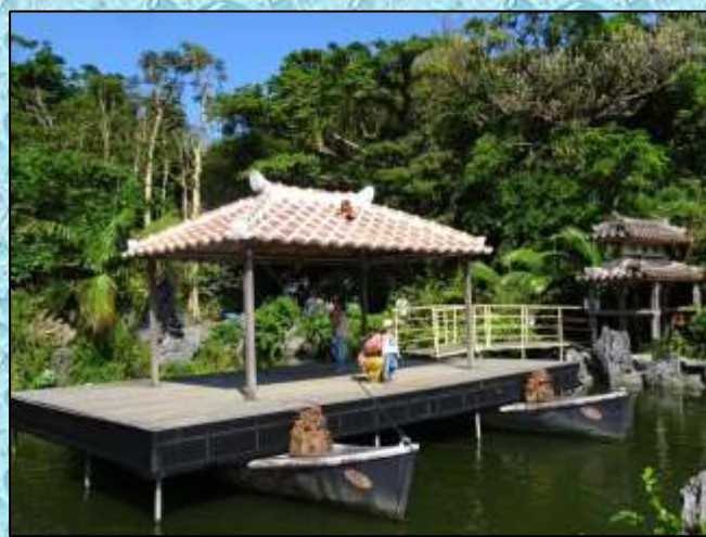
屋根に置かれたシーサー…