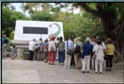
ひめゆりの塔：参拝