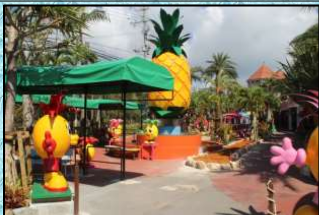
パイナップルパーク