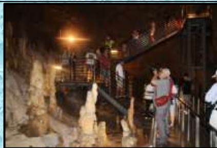
沖縄ワールド…玉泉洞①