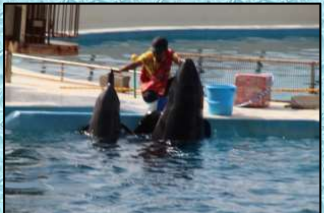
美ら水族館…イルカショー