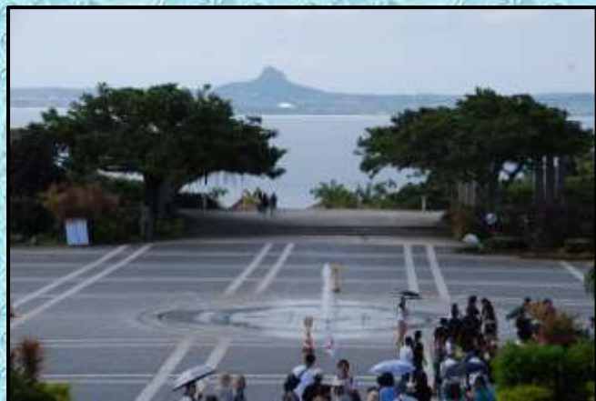
正面に伊江島が見える…