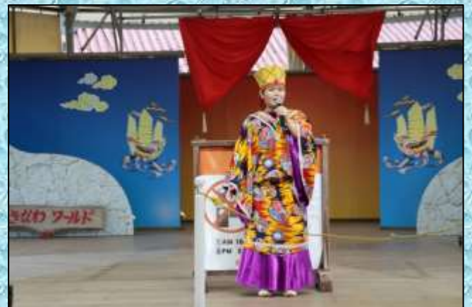
沖縄ワールドエイサーショー…