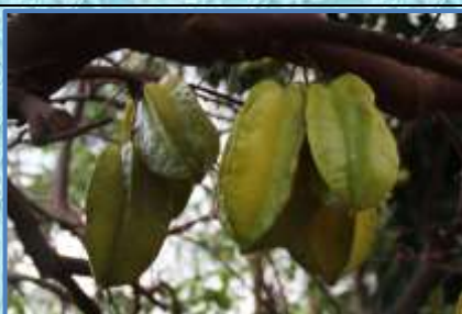
ゴレンジ(美味しくない?)