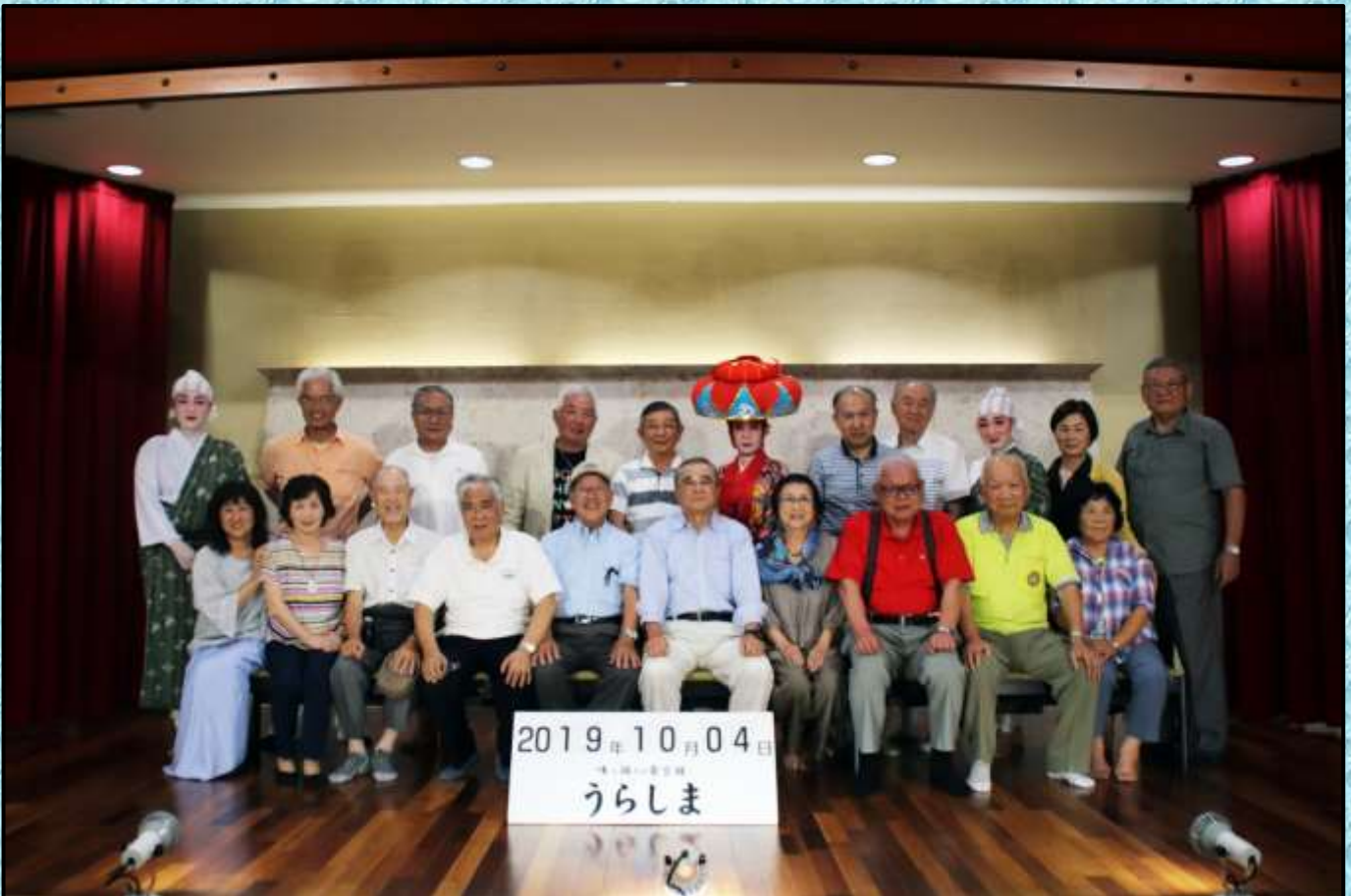
沖縄最後の夜を竜宮城「うらしま」で晚餐会