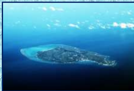
沖縄の島々が見える着陸間近!