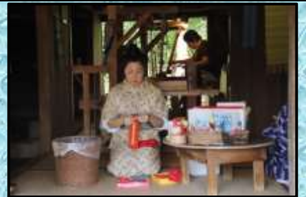
琉球村③民芸品の作成中