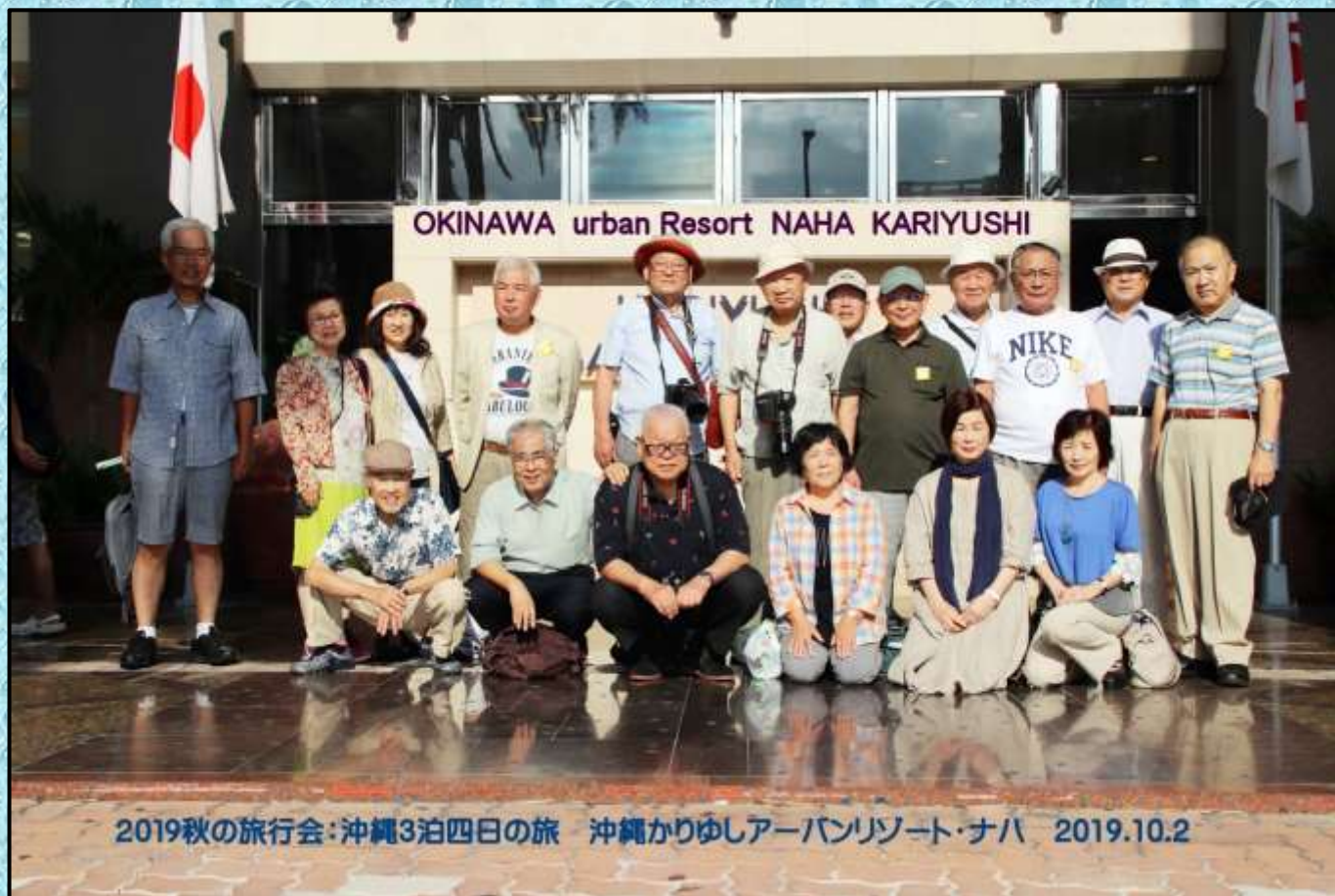
2019秋の旅行会:沖縄3泊四日の旅 沖縄かりゆしアーバンリゾート・ナハ 2019.10.2