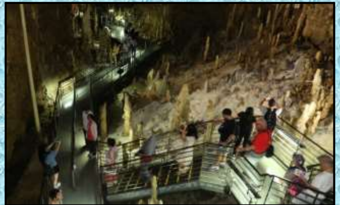
沖縄ワールド 玉泉洞…撮影：野村詩朗さん