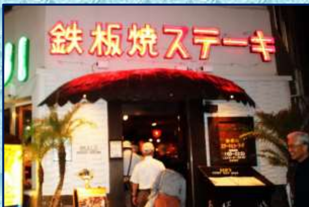
親睦会会場:サムズレストラン