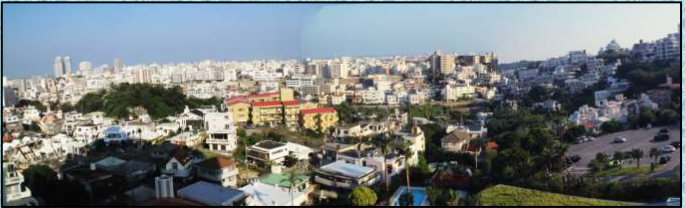
ホテルより那覇市内を望む…3枚の写真を合成(パノラマ化)