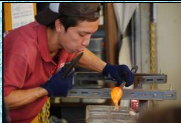
森のガラス館...