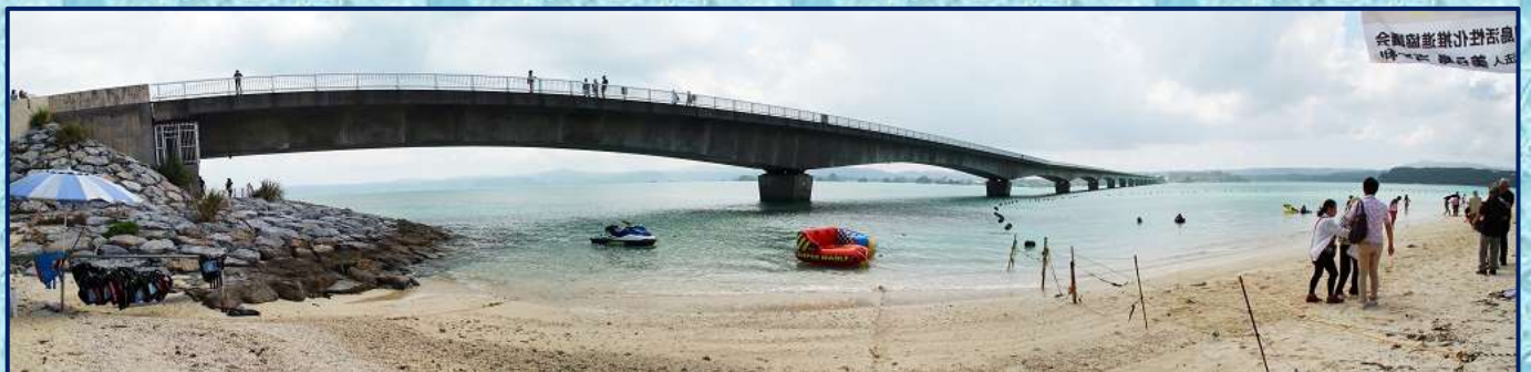
古宇利大橋（3枚の写真を合成（パノラマ化）しました