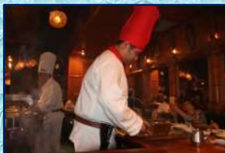
ステーキを焼くコックさん