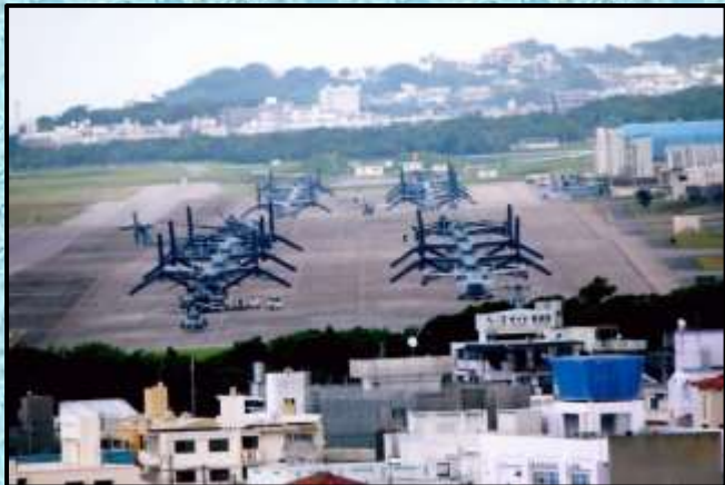
普天間基地…撮影・井上昭弘さん

◆ 10ページ、11ページは会員の皆様が撮影した中から、特に記憶に残った観光地やイベントを各人2作品を掲載させて頂きました。