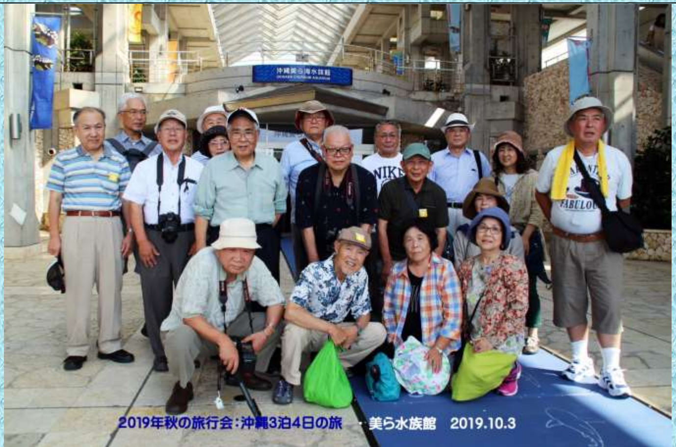
2019年秋の旅行会：沖縄3泊4日の旅 美ら水族館 2019.10.3