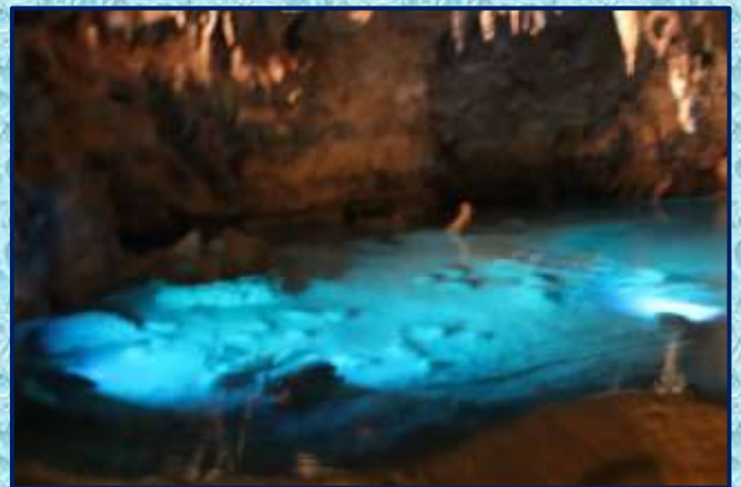
沖縄ワールド(エメラルドに輝く玉泉洞)