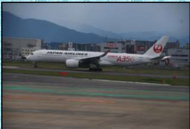
自己満足の1枚…国内初の最新鋭機 JAL A-350