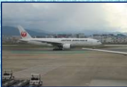
福岡空港:出発するJAL搭乗機