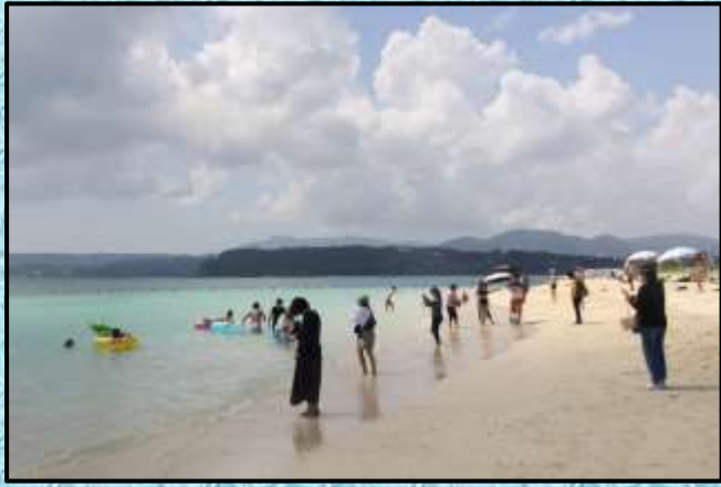
エメラルド色に映える沖縄の海…