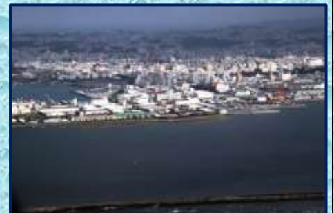
飛行機から見た那覇市内