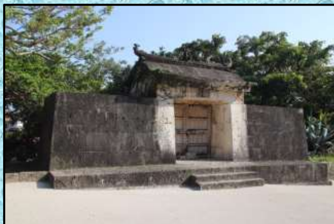
世界遺産 園比屋武御岳石門…撮影：川瀬悟志さん