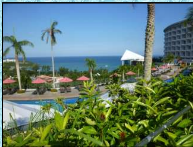
ホテルのプール…撮影：野口勝美さん