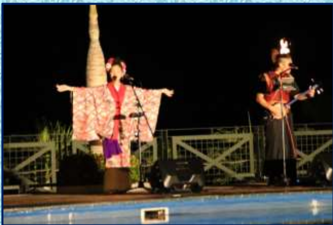
沖縄伝統芸能：エイサーショー（ホテル）