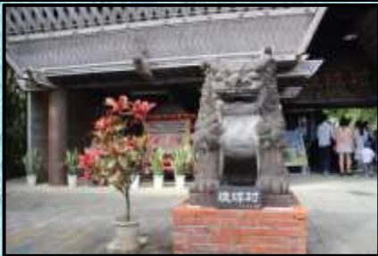
琉球村①シーサーがお出迎え