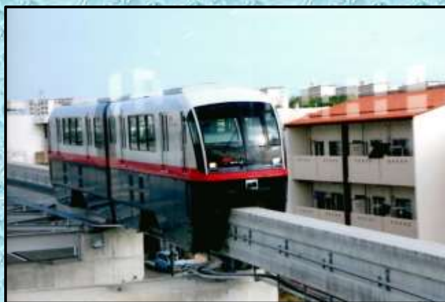
沖縄のモノレール…撮影：井上昭弘さん