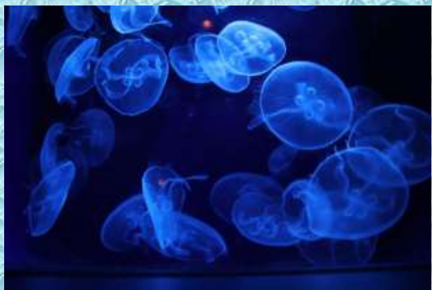
美ら水族館…クラゲ