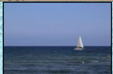
エメラルドに輝く海…車窓より