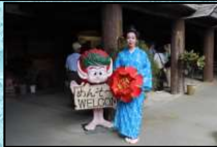
琉球村②沖縄美人のお出迎え