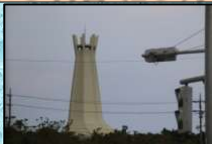
沖縄平和祈念塔…車窓より