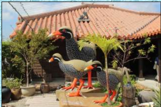
御菓子御殿・ヤンバルクイナ…