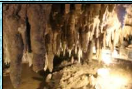
沖縄ワールド…玉泉洞