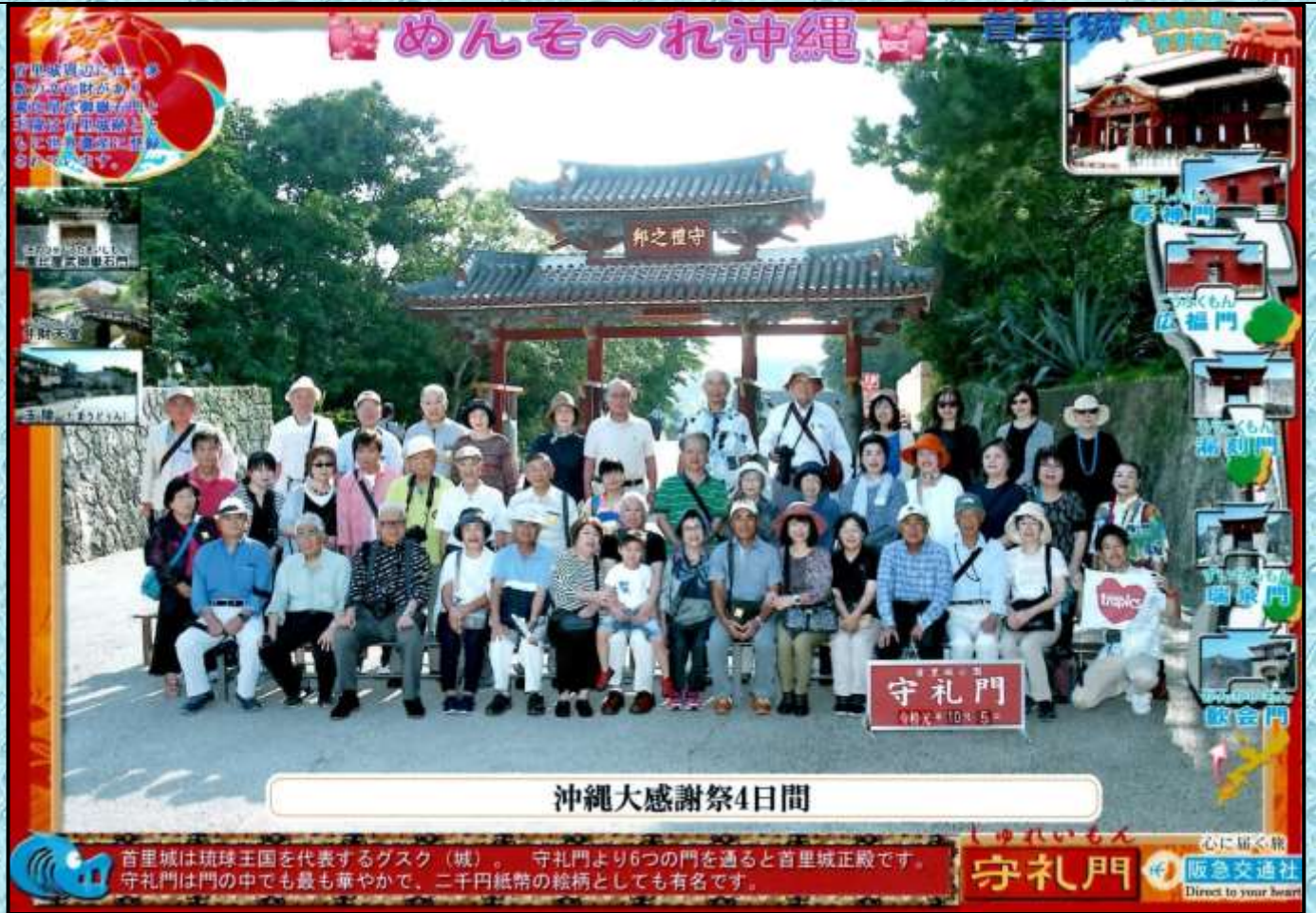
沖縄のシンボル：守礼門(ツアー参加の皆さんと一緒に撮影)