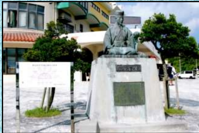
野国総官の像…撮影：井上昭弘さん