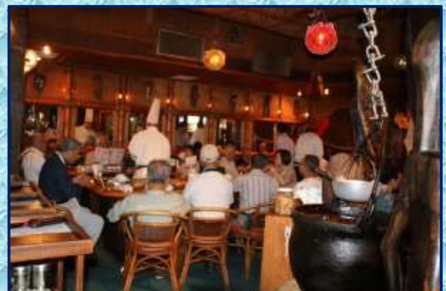
初日:サムズレストランでの懇親会の模様