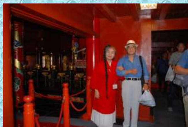
首里城・正殿にて沖縄の女性と