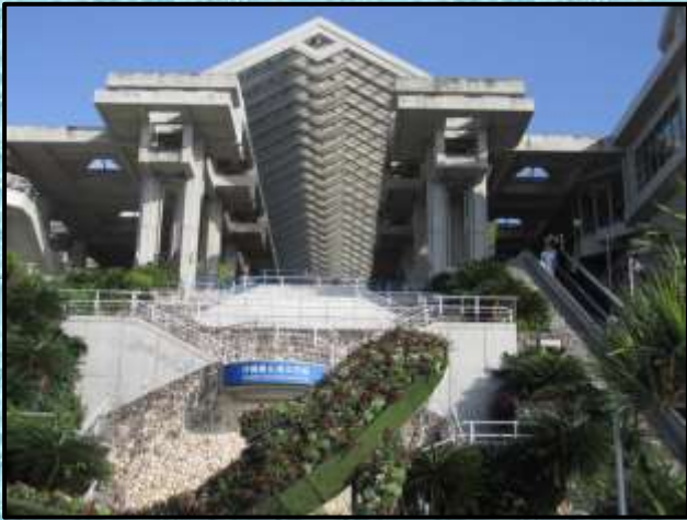
海洋博公園…撮影：毛利勇二さん