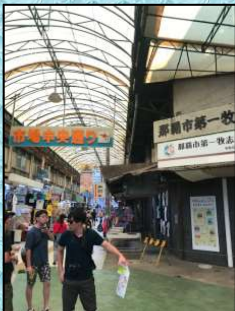
那覇市場中央通…自由行動散策