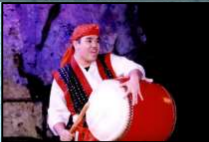
エイサー観劇④