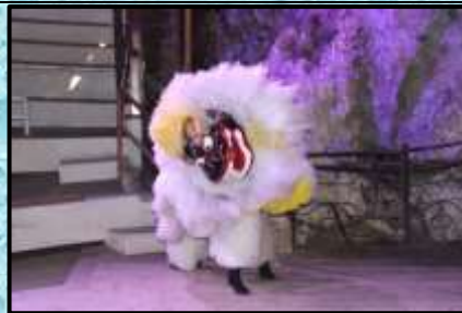
琉球村⑤きじむな劇場・観劇