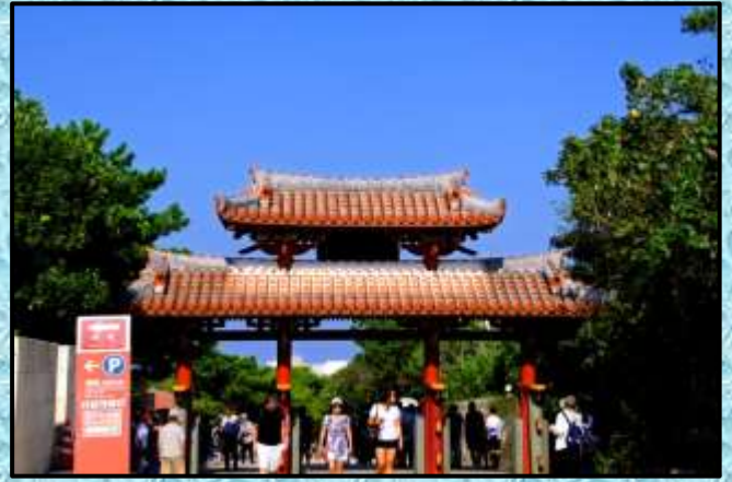
守礼の門