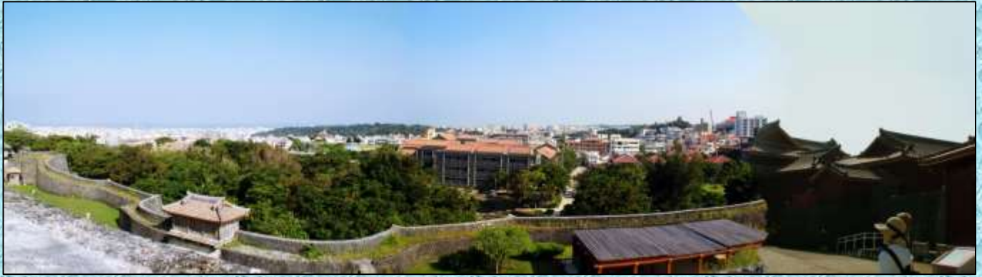
首里城より市内を望む(城壁に注目!!)…3枚の写真を合成(パノラマ化)