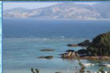
沖縄の風景：バスノ車窓より