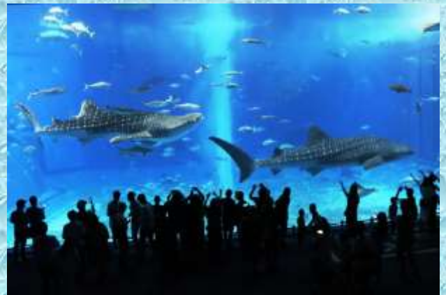
美ら水族館…世界最大のジンベイザメ