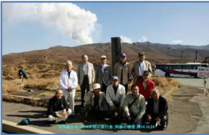
阿蘇山・ロープウェイ駐車場で