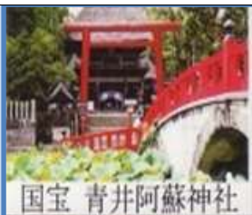
国宝 青井阿蘇神社