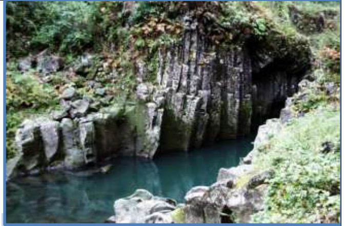
高千穂峡…仙人の屏風岩