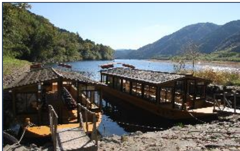
私たちが案内してくれた遊覧船