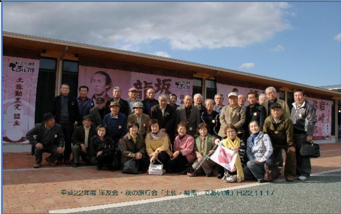
平成22年度 洋友会・秋の旅行会「土佐・龍馬 であい博」H22.11.17