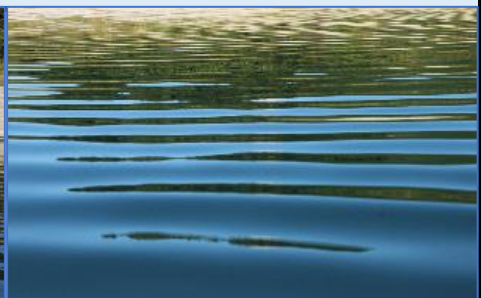
この綺麗な四万十の水