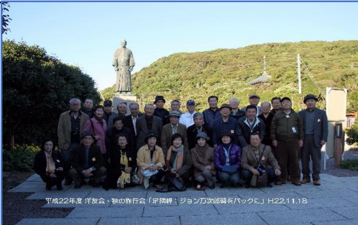
平成22年度 洋友会・秋の旅行会「足摺岬：ジョン万次郎碑をバックに」H22.11.18