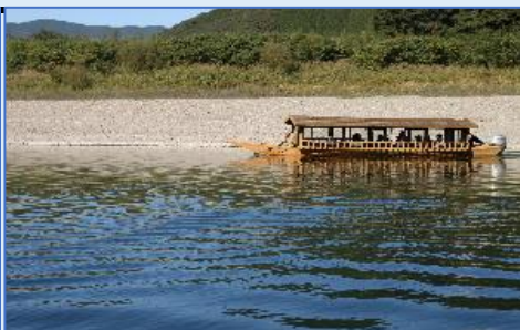
四万十の清流を静かにやさしく遊覧