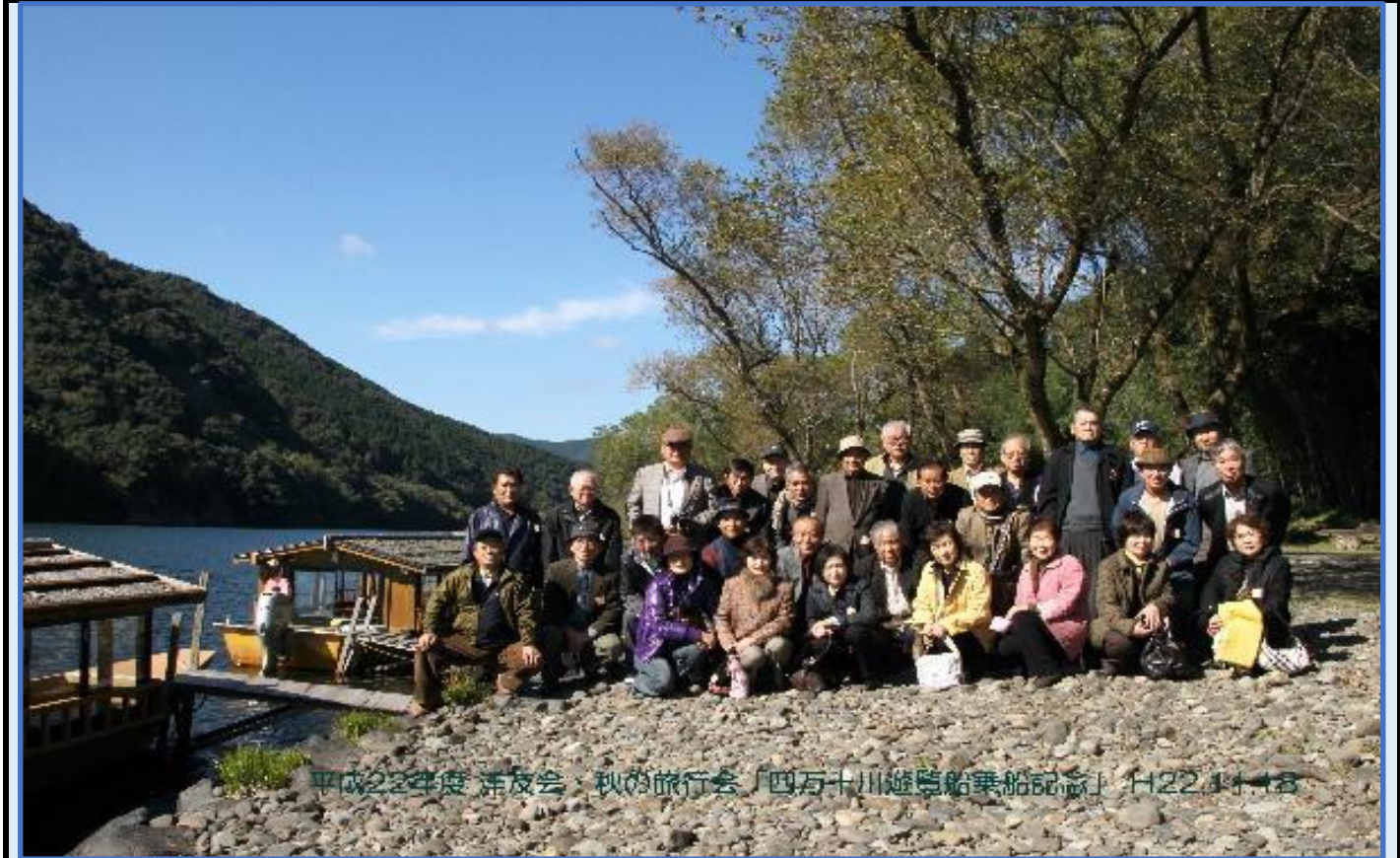
平成22年度 浜友会・秋の旅行会「四万十川遊覧船乗船記念」H22.11.18