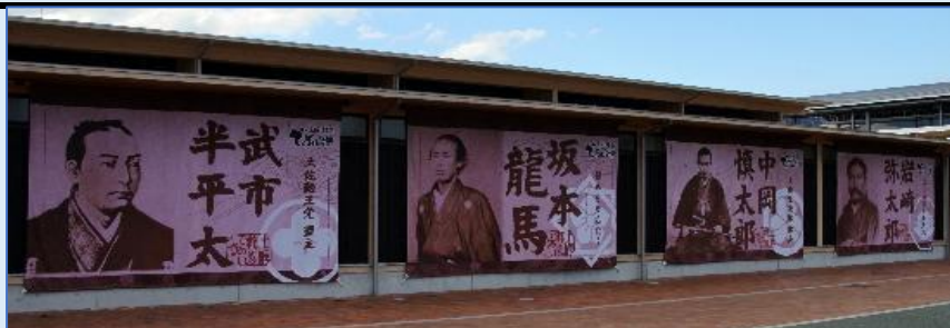
「土佐・龍馬であい博」メイン会場