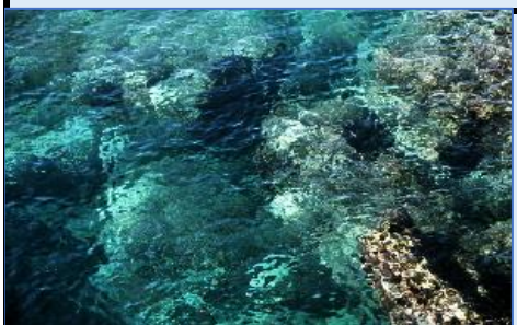
見事な輝きを見せる「足摺の海」