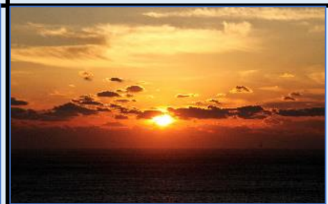
朝日が昇る：足摺岬展望台より