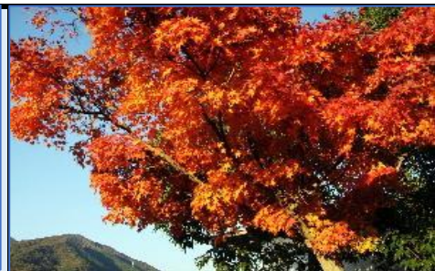
最後のサービスエリアで見た紅葉