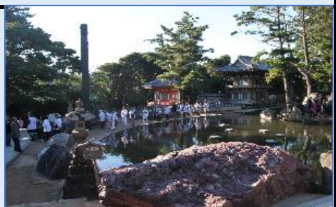
弘法大師建立の金剛福寺参拝