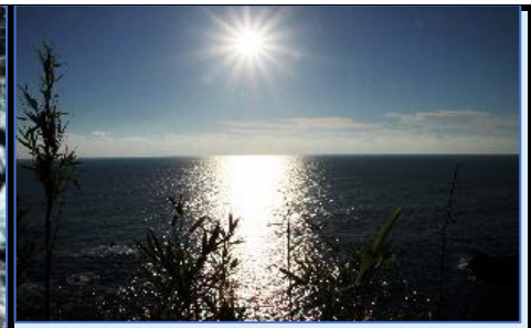
まばゆい太陽足摺の輝き