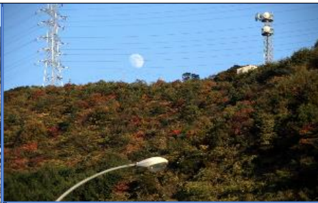
車窓より見た見事な紅葉とお月様・宇和島近辺？