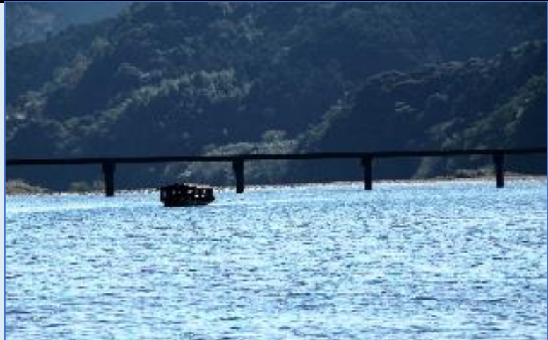
日本最後の清流「四万十川と沈下橋」