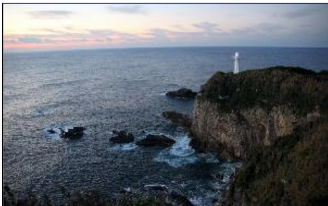
朝を迎え撃つ足摺岬の灯台