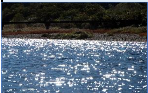
輝く「四万十の清流」